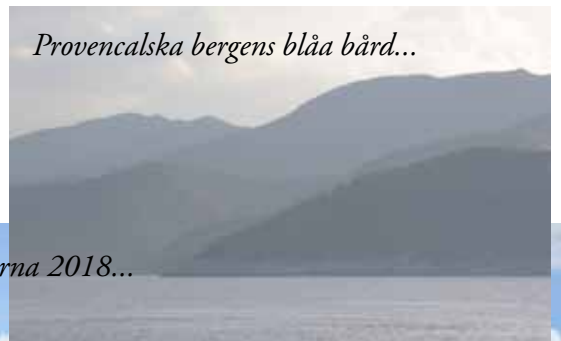
Provencalska bergens blåa bärd...

Planeringen för nästa hösts Taube-segling är redan i gång. Den börjar i Anienes myrtenlund utanför Rom. Det var där Taube såg Astri stå naken i vattenfallet – något Astri bestämt förnekat. Seglingen går sedan ner längs Italienska kusten. Mer om detta i nästa medlemsbrev.