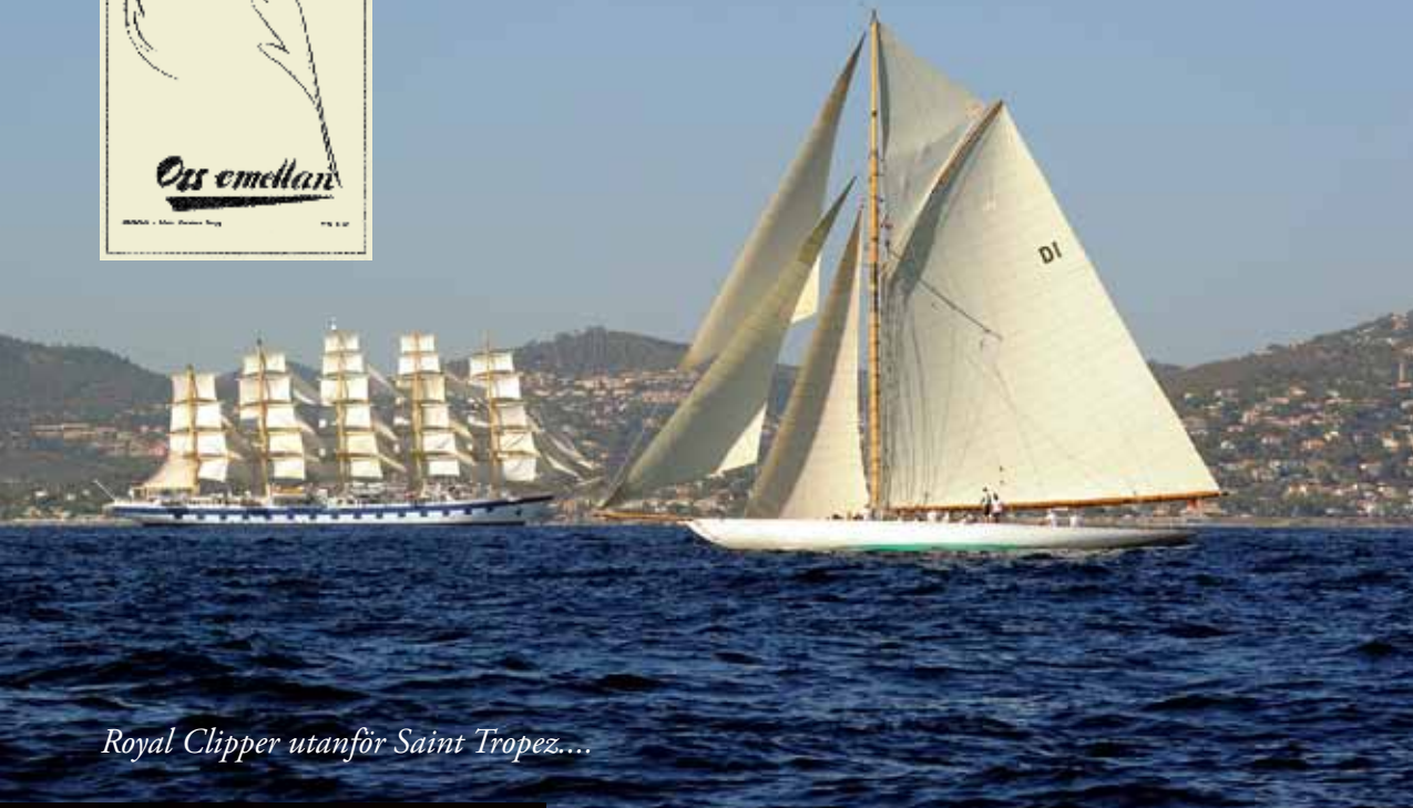
Royal Clipper utanför Saint Tropez....

TJUGO GLADA SJÖJUNGFRUR och sjömän gick ombord på världens största segelfartyg, Royal Clipper. Det var den 29 september och vårt skepp låg på redden i Cannes.